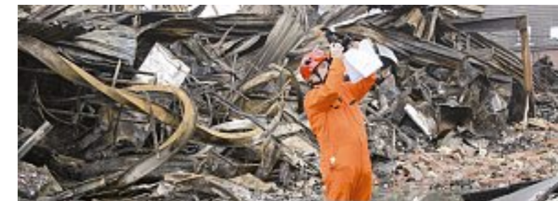
Een medewerker van het Team Brandonderzoek (TBO) in actie

Inmiddels zijn er nieuwsbrieven gemaakt met de onderwerpen: kinderopvang, Vlinderveen, Hoofddorp en Zaandam, uitbreiding via dakconstructies en OMS meldingen.