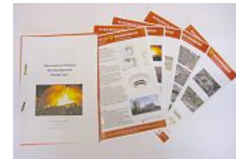
De eerste resultaten

In de pilot die nu loopt wordt onder brandonderzoek verstaan het verzamelen van feitelijke gegevens en het reconstrueren van de gebeurtenissen bij een brand. Om die gegevens te verzamelen zijn vijf mensen opgeleid die zich hiermee bezig houden. In 2008 zijn deze medewerkers betrokken geweest bij 31 branden die door de politie werden onderzocht.